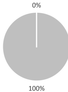
2. Alignement des investissements, y compris des obligations souveraines*, sur la taxinomie

■ Alignés sur la Taxinomie ■ Autres investissements